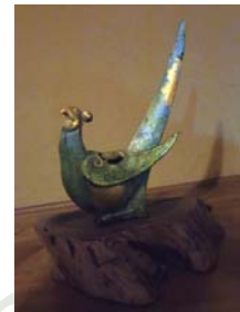
お気に入りの香炉

これ、難しいんですよ...人それぞれなので(苦笑)。でも敢えてお薦めするなら、夏場はムスクやローズなどの香りがキツイものよりは、フルーツ系や植物系(グリーン)の爽やかなものが良いと思います。個人的には、白檀が古くから人々に好まれており、日本ではよくお茶会などの香袋にも使われているので、親しみやすくリラックス効果もあるのでお薦めです。でも肝心なのは、自分にあった楽しいスタイルを見つけるのが一番!なので、是非みなさんにも【自分だけのお香】を探してみてくださいませ。