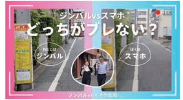
ジンバルの使用・不使用の比較映像

このように、様々なタイプのジンバルがあるので、自分の利用用途や予算に応じて選んでみましょう。ちなみに「単軸」「三軸」という言葉が出て来ましたが、補正をする方向が「上下」だけなど1つの方向だけのものを「単軸」、「上下」「左右」「傾き」の3方向補正するものを「三軸」といいます。