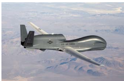
RQ-4 グローバルホーク

元々ドローンは無人で飛ぶことができる航空機のことを意味していました。軍事用の数十メートルあるような攻撃機などもドローンの一種です。最近話題になっているのは、ドローンの中でも小型のもので、直径が数十センチほどのものです。つまりドローンとは、高度なコンピュータ制御により無人で飛行可能なもの全般を表しているのです。