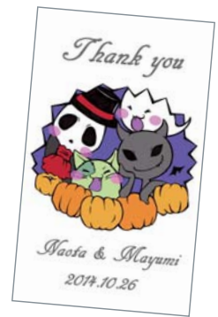
ハロウィンカード