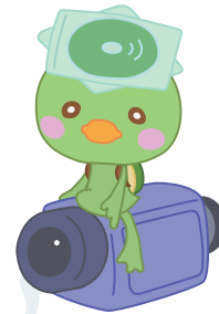
ダビングセンターのニューキャラクター!?

東京ビックサイトでデザインフェスタというイベントが年に2回あって、いつかそこに出展してみたいです！デザインフェスタは、オリジナルであれば、プロ・アマチュア問わず、「自由に表現出来る場」を提供するアートイベントなので、音楽から家具までいろんな分野のオリジナル作品を発表したり、売ったりするんですよ。オリジナルデザインをする人もしない人も、とってもワクワクするイベントなので、是非皆様も足を運んで下さい！そのうち私も出展しているかも?!