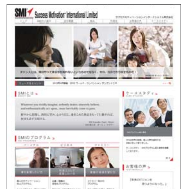
日本SMI公式ホームページ

SMI社の提供するプログラムは、真の成功を達成し、充実した人生を過ごすためのノウハウを教えてくれる、私たち迷える大人のための教材と言えるのではないのでしょうか。